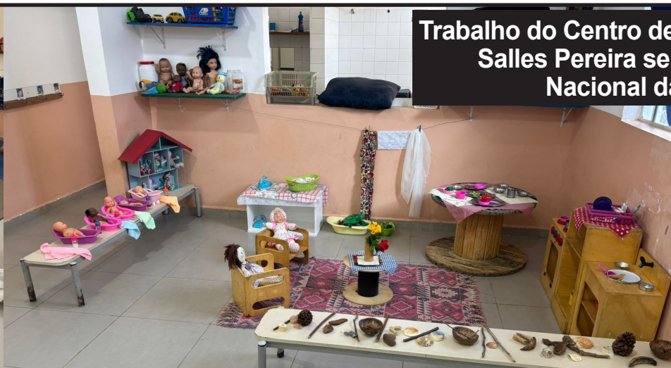
Trabalho do Centro de Educação Infantil Profª Aracy Salles Pereira será exposto no II Encontro Nacional da Rede Pikler Brasil