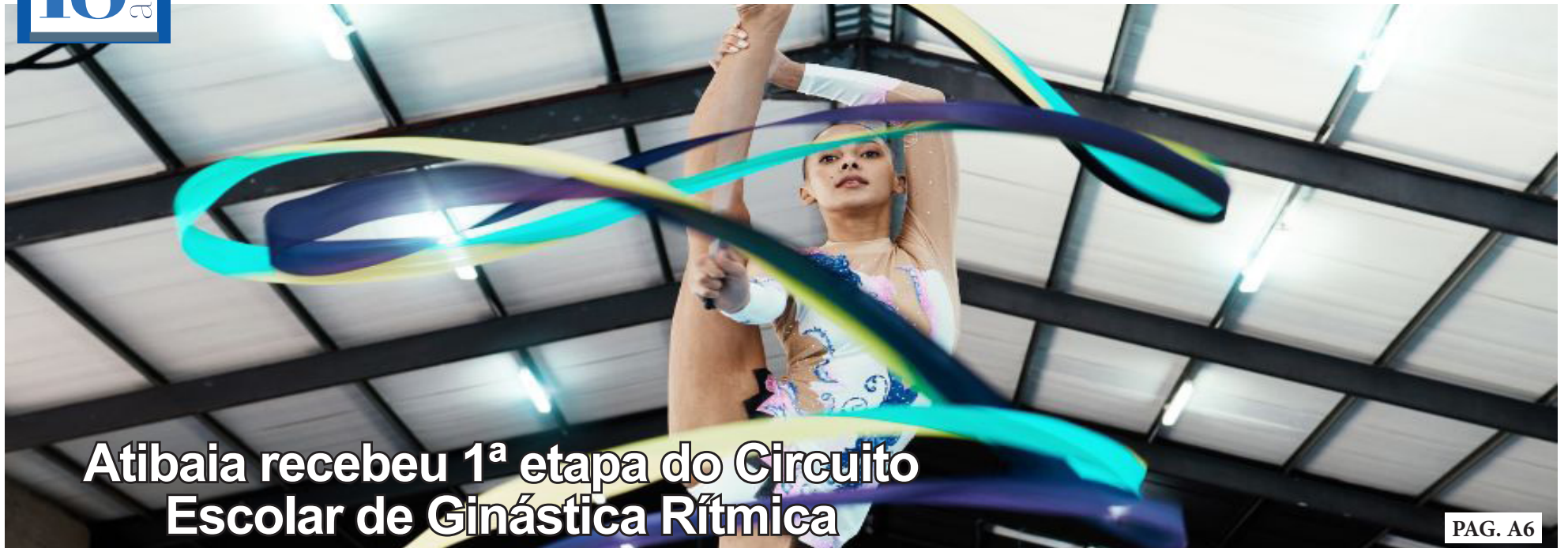
Atibaia recebeu 1ª etapa do Circuito Escolar de Ginástica Rítmica